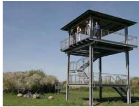
Aussichtsturm auf dem „Kratzert“

Informationen zu den einzelnen kulturellen Sehens-