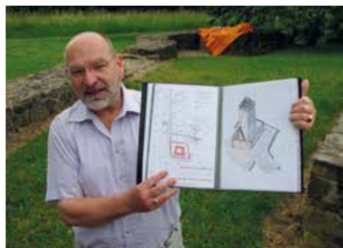
Führung Burgwüstung Hainfeld, Lich-Muschenheim

Heute wohnt er selbst in dem achtältesten Fachwerkhaus Hessens. Es ist seit 1931 Kulturdenkmal, wurde mehrfach ausgezeichnet und trägt die Kulturgut-Plakette der Bundesrepublik Deutschland, die Kulturdenkmal-Plakette des Ministeriums für Wissenschaft und Kunst Hessen sowie die Denkmal-Plakette der Bausparkasse GdF Wüstenrot. Besuche von Zimmerleuten, die sich das liebevoll restaurierte Haus anschauen wollen, sind keine Seltenheit. Und so gibt er Fachleuten und Interessierten sein angeeignetes Wissen gerne weiter.