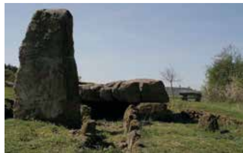
Megalithgrab „Heiliger Stein“