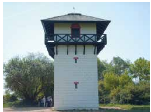
Limes-Wachturm aus Stein (Modell)