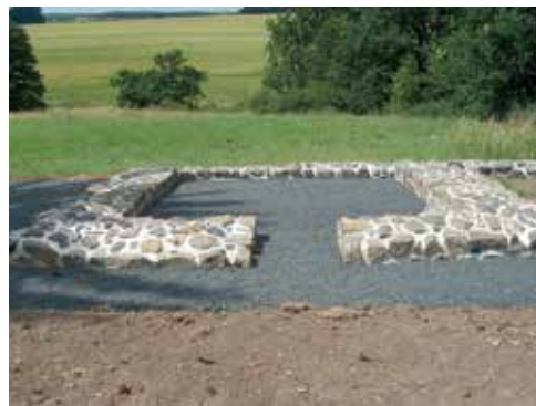
Nordtor Kastell Arnsburg-Alteburg

Entdecken Sie auf historischen Stadtführungen, an denen Sie auch in Kostüme gekleidet teilnehmen können, und auf Planwagenfahrten das eine oder an-