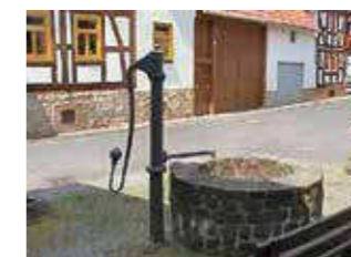
Birklar Höhe: 193 m ü. NHN Fläche: 4,57 km 2 Einwohner: 681 (Dez. 2015) Eingemeindung: 31. Dezember 1970