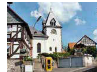
Bettenhausen Höhe: 182 m ü. NHN Fläche: 5,21 km 2 Einwohner: 522 (Dez. 2015) Eingemeindung: 31. Dezember 1971