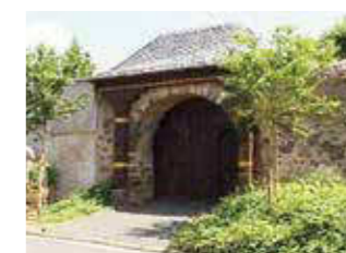
Muschenheim Höhe: 163 m ü. NHN Fläche: 7,81 km 2 Einwohner: 967 (Dez. 2015) Eingemeindung: 31. Dezember 1970