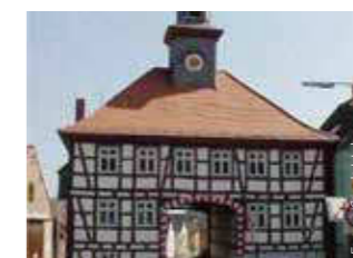
Ober-Bessingen Höhe: 186 m ü. NHN Fläche: 4,2 km 2 Einwohner: 563 (Dez. 2015) Eingemeindung: 31. Dezember 1970