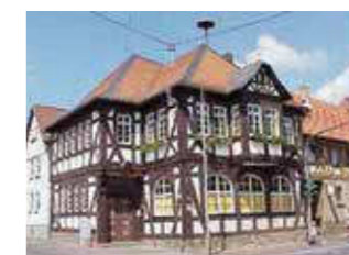
Langsdorf Höhe: 167 m ü. NHN Fläche: 12,29 km 2 Einwohner: 1385 (Dez. 2015) Eingemeindung: 1. Januar 1977