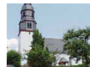
Eberstadt Höhe: 178 (178–221) m ü. NHN Fläche: 5,46 km 2 Einwohner: 842 (Dez. 2015) Eingemeindung: 1. Februar 1971