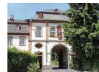
Kloster Arnsburg Höhe: 163 m ü. NHN Fläche: 4,9 km 2 Einwohner: 61 (Dez. 2015) Eingemeindung: 1. Januar 1977