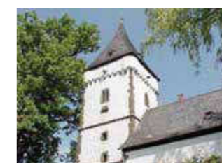
Nieder-Bessingen Höhe: 173 m ü. NHN Fläche: 5,3 km 2 Einwohner: 597 (Dez. 2015) Eingemeindung: 31. Dezember 1970